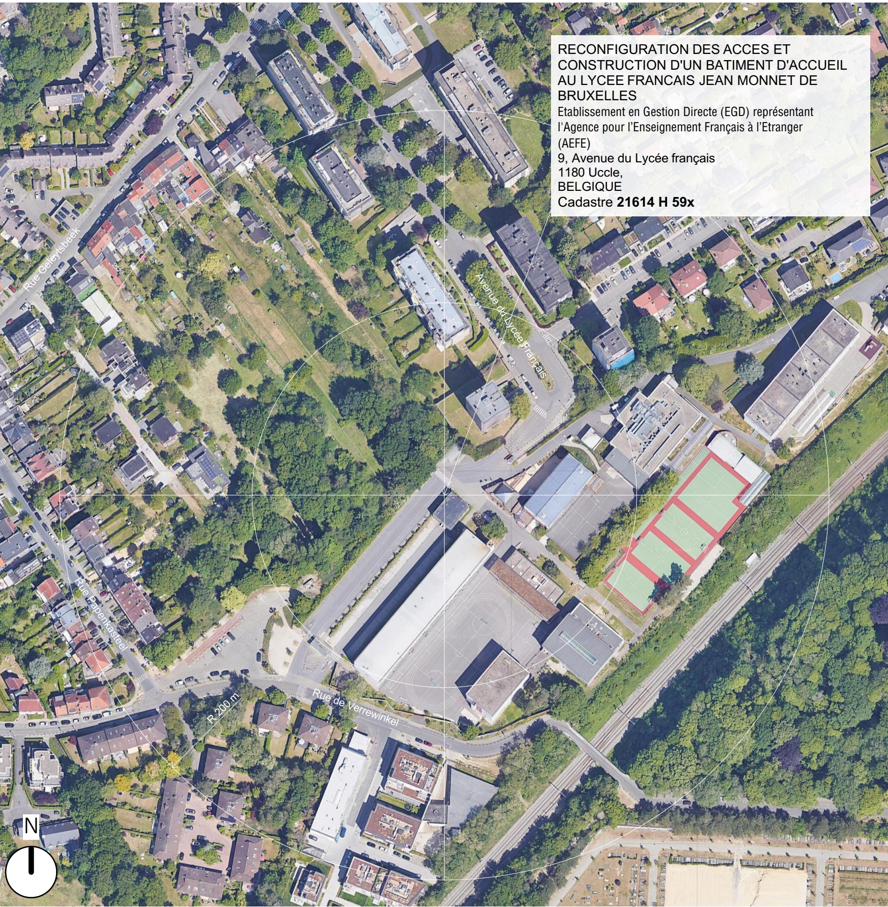
Plan de situation existante _ 1/2000e